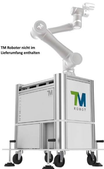
TM Roboter nicht im Lieferumfang enthalten