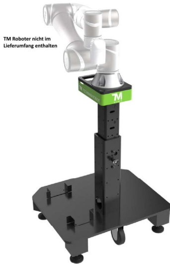
TM Roboter nicht im Lieferumfang enthalten